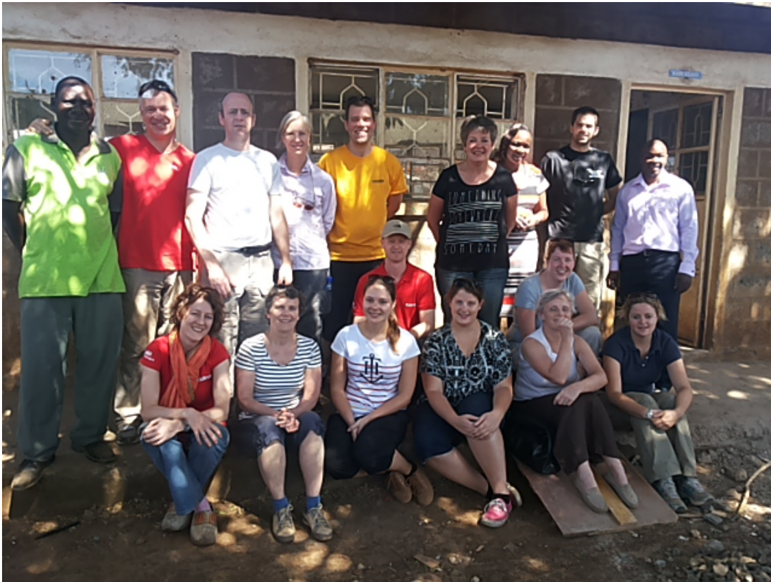
De bouwgroep van de Oosterkerk uit Zeist.

Er is hard gewerkt door de betaalde lokale krachten, de studenten van Blessed Generation en door onze vele bezoekers. Echt super goed!