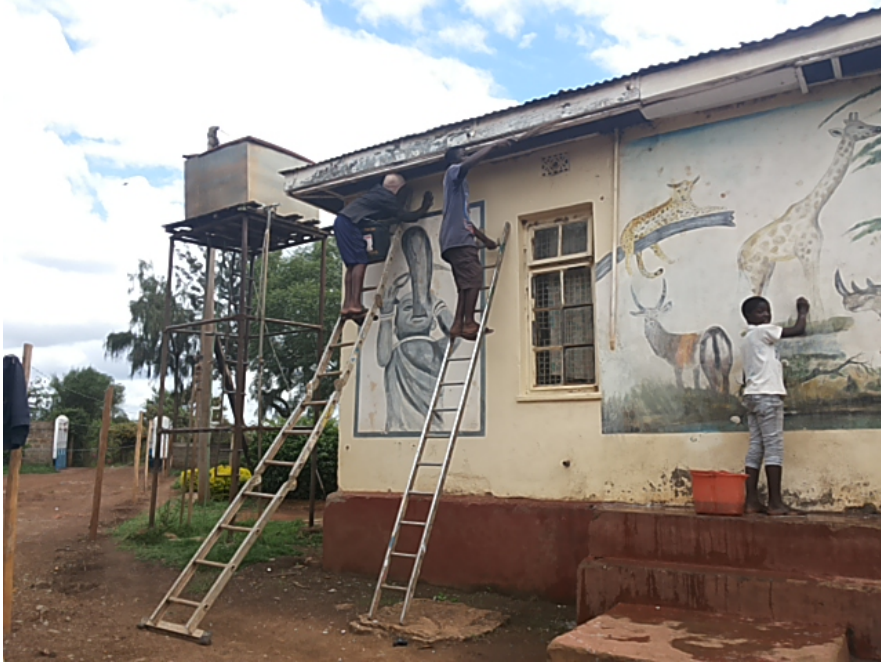
Dit was de buitenkant van een slaapzaal.