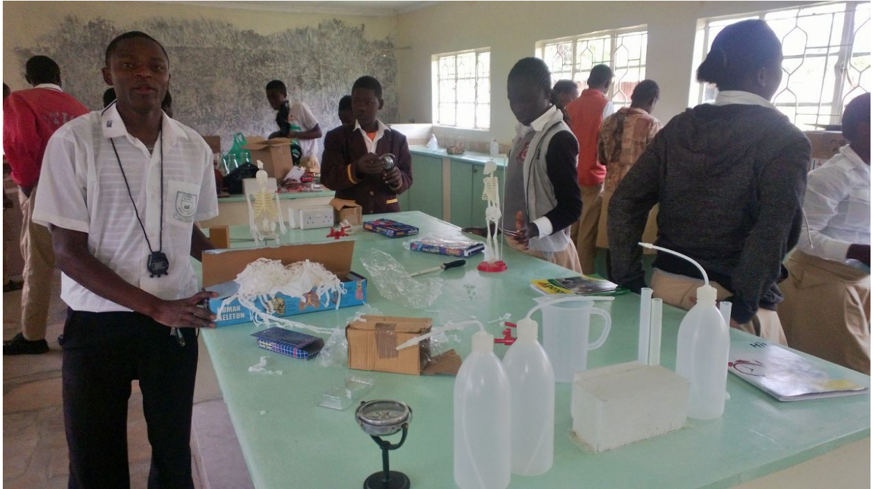
De twee voormalige kleuterlokalen zijn nu een schei- en natuurkundelaboratorium