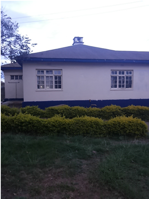
Dit is de buitenkant van een slaapzaal nu.