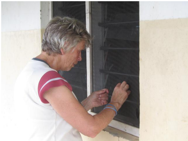
Reparatie aan de horren in Malindi