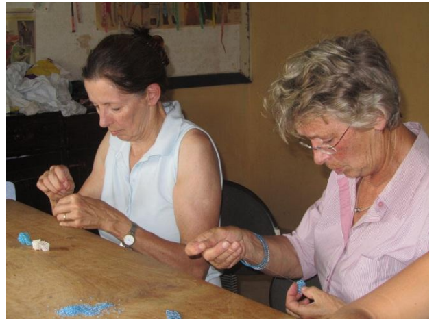
Kettinkjes maken met de kinderen

De bedoeling was om wat schilderijtjes van de kinderen mee naar Nederland te nemen en ze te verkopen tijdens de veiling in Meije ten bate van Blessed Generation.