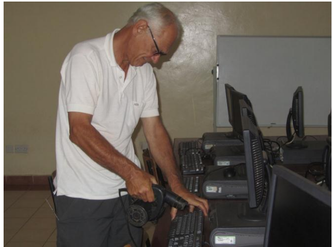
Schoonmaken computerruimte in Ruiru