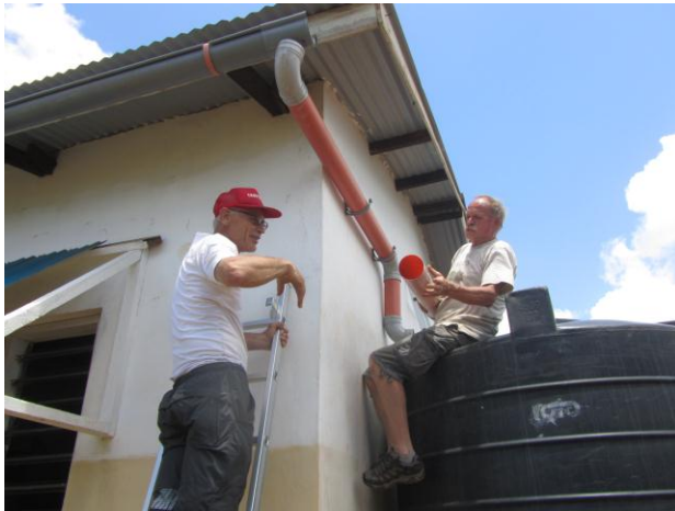
Reparatie van de dakgoten in Malindi

De mannen hebben in Malindi een deel van de kapotte dakgoten vervangen en de dames zijn met een groepje kinderen gaan tekenen/schilderen.