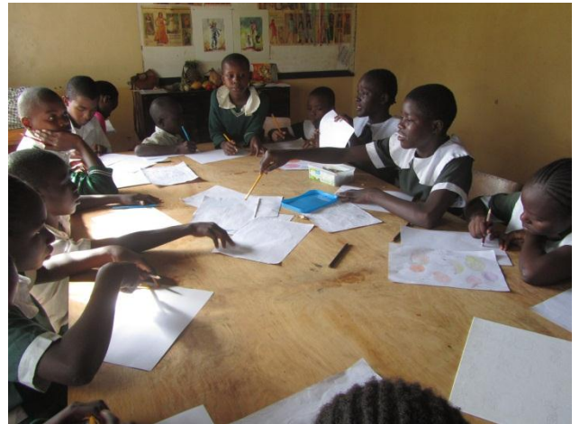
Tekenen voor de veiling in Meije